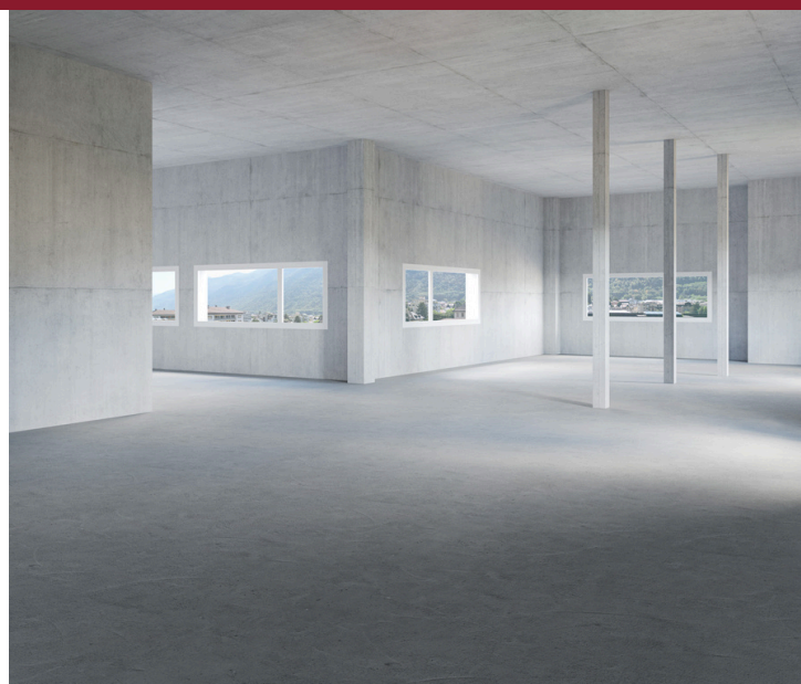
LOT 2 & 3 - 136 M 2