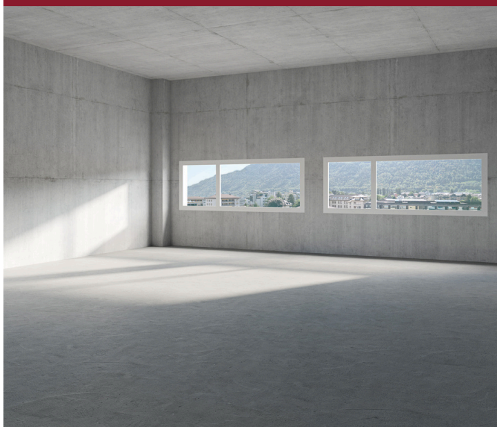
LOT 1 - 72 M 2