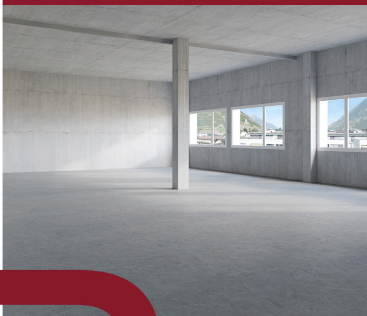
LOT 4 & 5 - 140 M 2